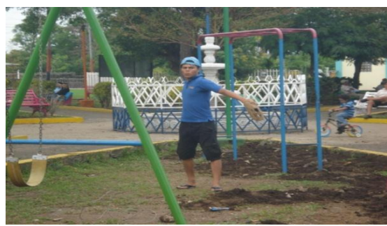
Jóvenes en el área de juegos infantiles