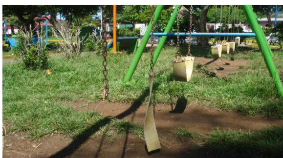
Juegos infantiles parque El Rosario