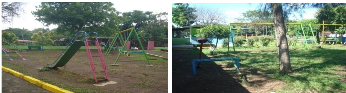
Infraestructura infantil parque El Rosario

En los diversos espacios observados no hay medidas de seguridad ni marco perimetral, a excepción de la cancha Mormona que es propiedad privada y su uso es restringido por estar bajo el criterio de sus dueños.