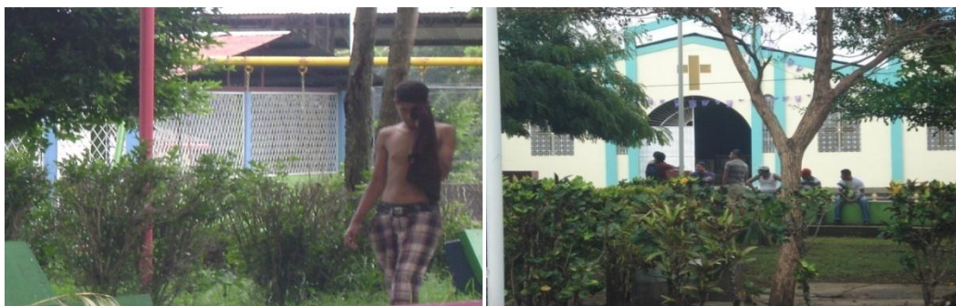
Grupos juveniles en el parque El Rosario

Muchos padres de familia no dejan asistir a sus hijos a estos espacios, para no exponerlos a mal ejemplo de los alcohólicos o inhalantes o bien para no exponerlos a un robo, agresión o acoso de parte de los mismos.